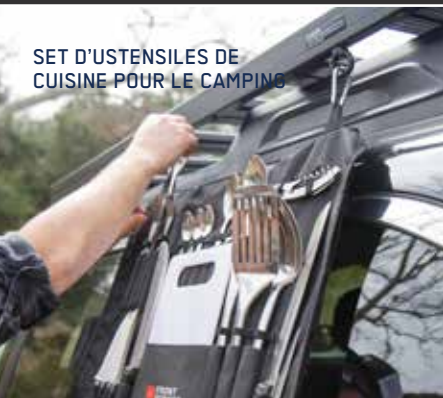
SET D'USTENSILES DE CUISINE POUR LE CAMPING