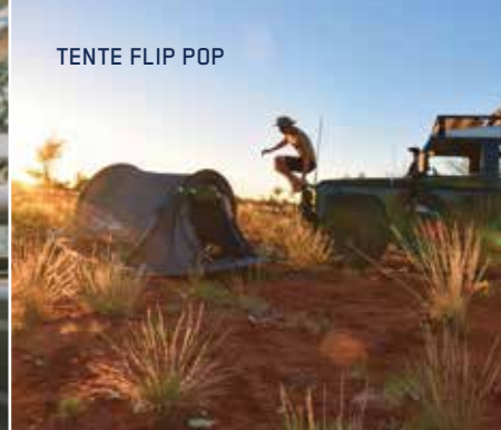
TENTE FLIP POP