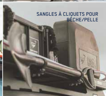
SANGLES À CLIQUETS POUR BÊCHE/PELLE