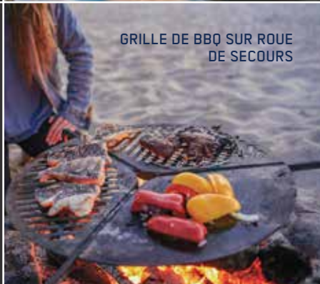
GRILLE DE BBQ SUR ROUE DE SECOURS