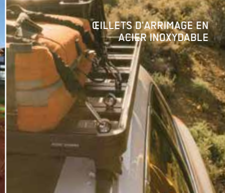
ŒILLETS D'ARRIMAGE EN ACIER INOXYDABLE