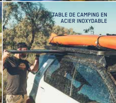
TABLE DE CAMPING EN ACIER INOXYDABLE