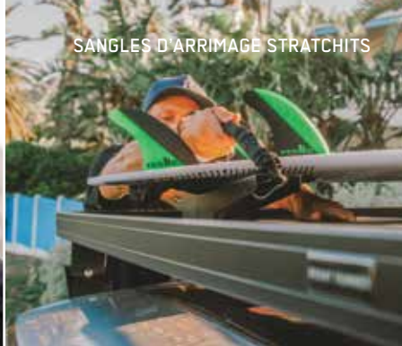
SANGLES D'ARRIMAGE STRATCHITS