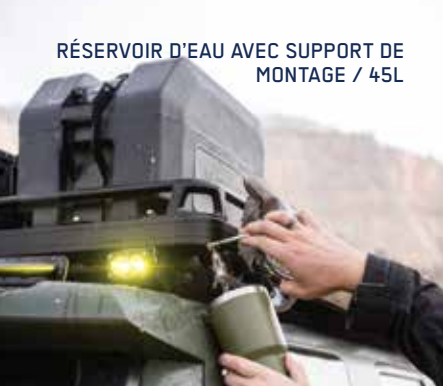
RÉSERVOIR D'EAU AVEC SUPPORT DE MONTAGE / 45L