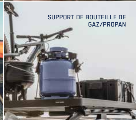
SUPPORT DE BOUTEILLE DE GAZ/PROPAN